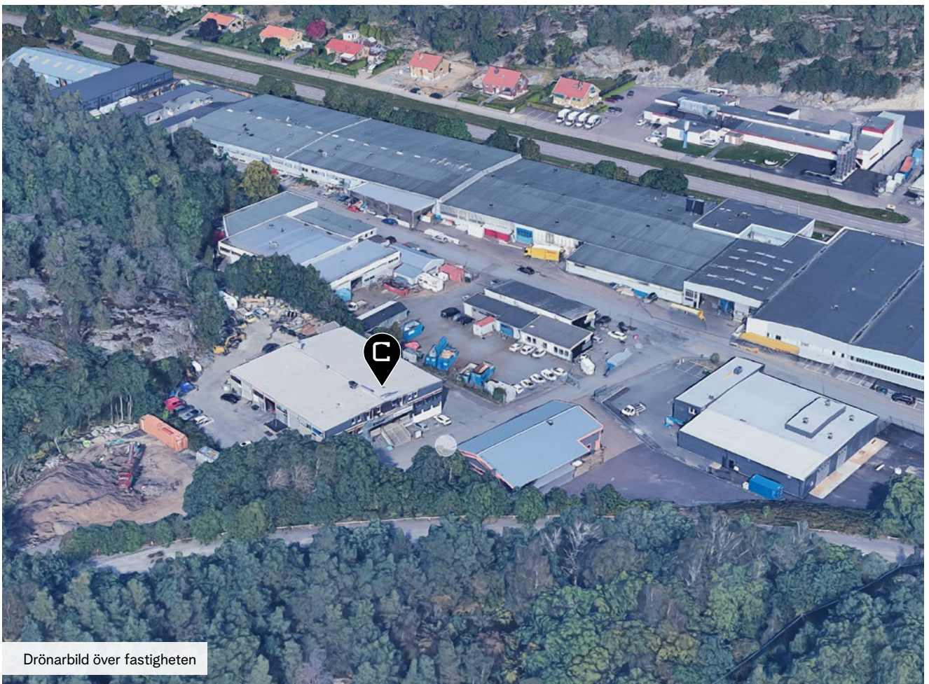
Drönarbild över fastigheten