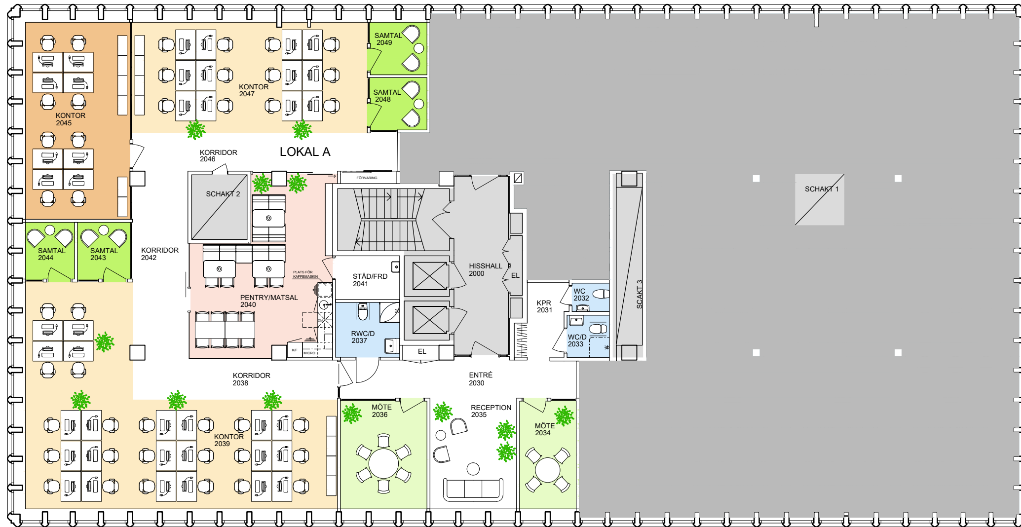
PLAN 6, 2 TR.